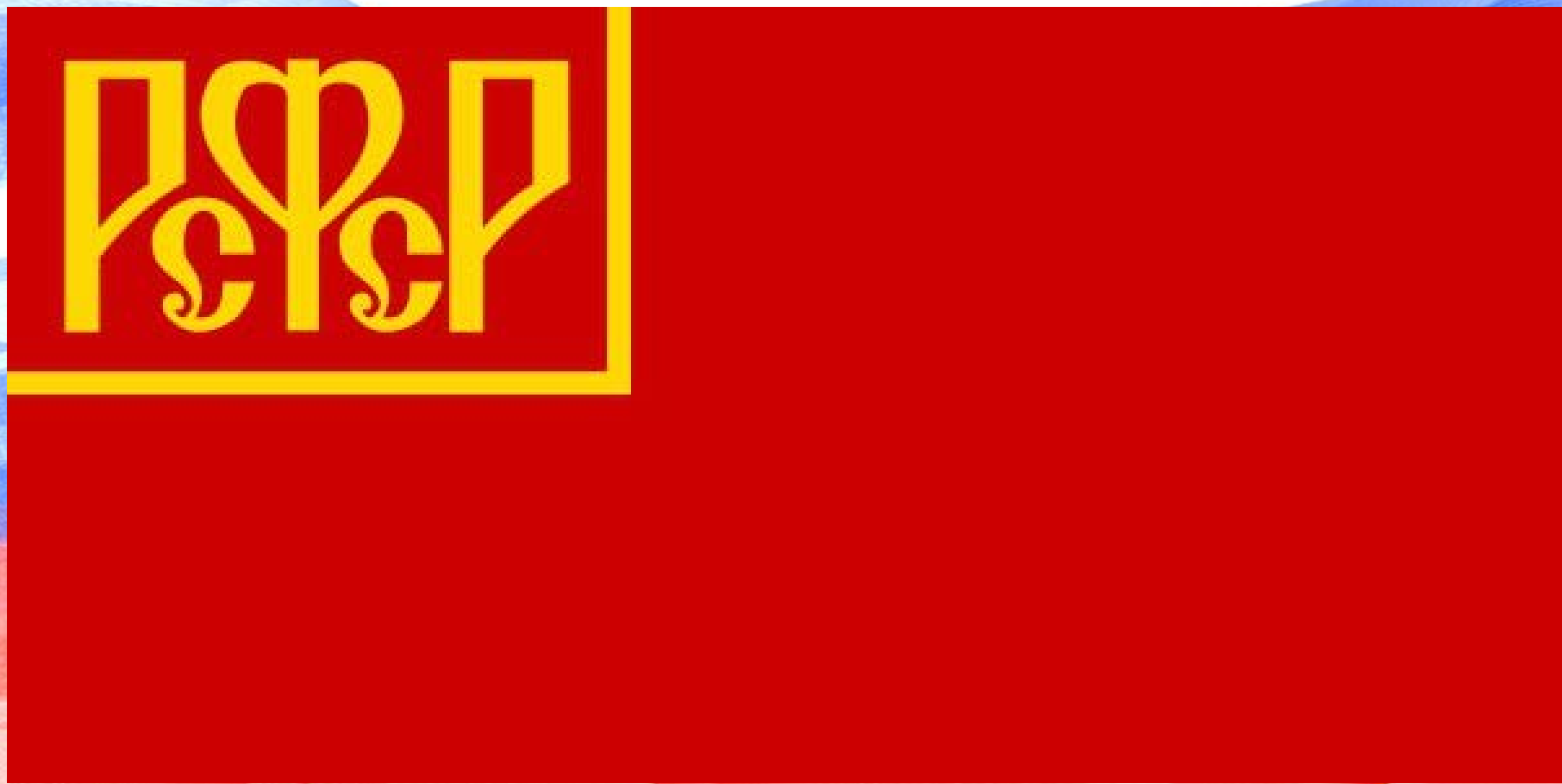
Государственный флаг РСФСР.1918г.

В апреле 1918 г. был утверждён декрет о флаге РСФСР: Флагом Российской Республики устанавливается красное знамя с надписью «Российская Социалистическая Федеративная Советская Республика».