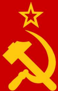
Государственный флаг СССР

18 апреля 1924 г. президиум ЦИК СССР утвердил новый флаг Союза Советских Социалистических Республик: красное полотнище с золотым серпом и молотом со звездой в верхнем углу у древка.