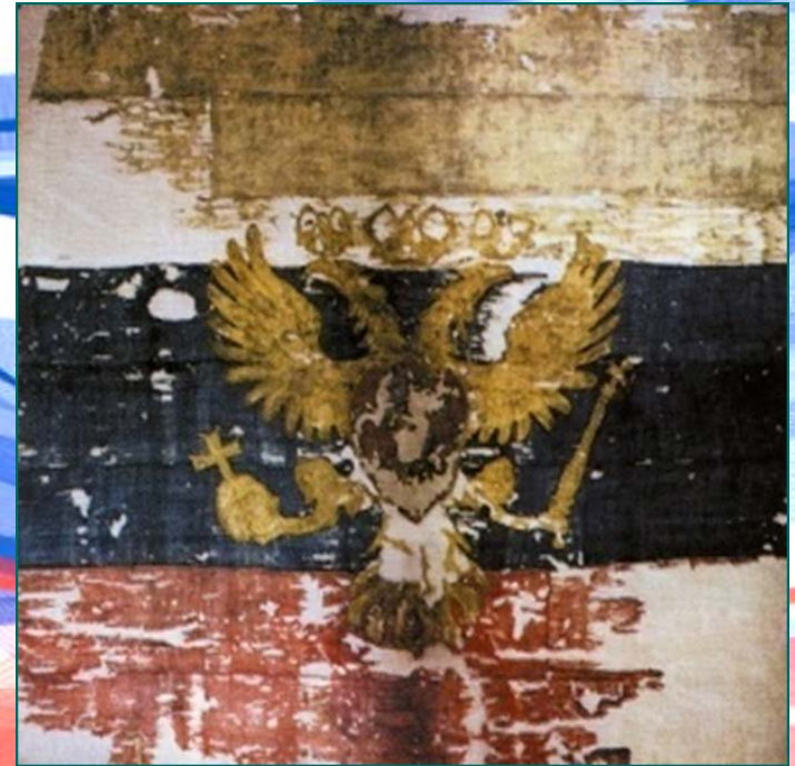
«Флаг царя Московского»