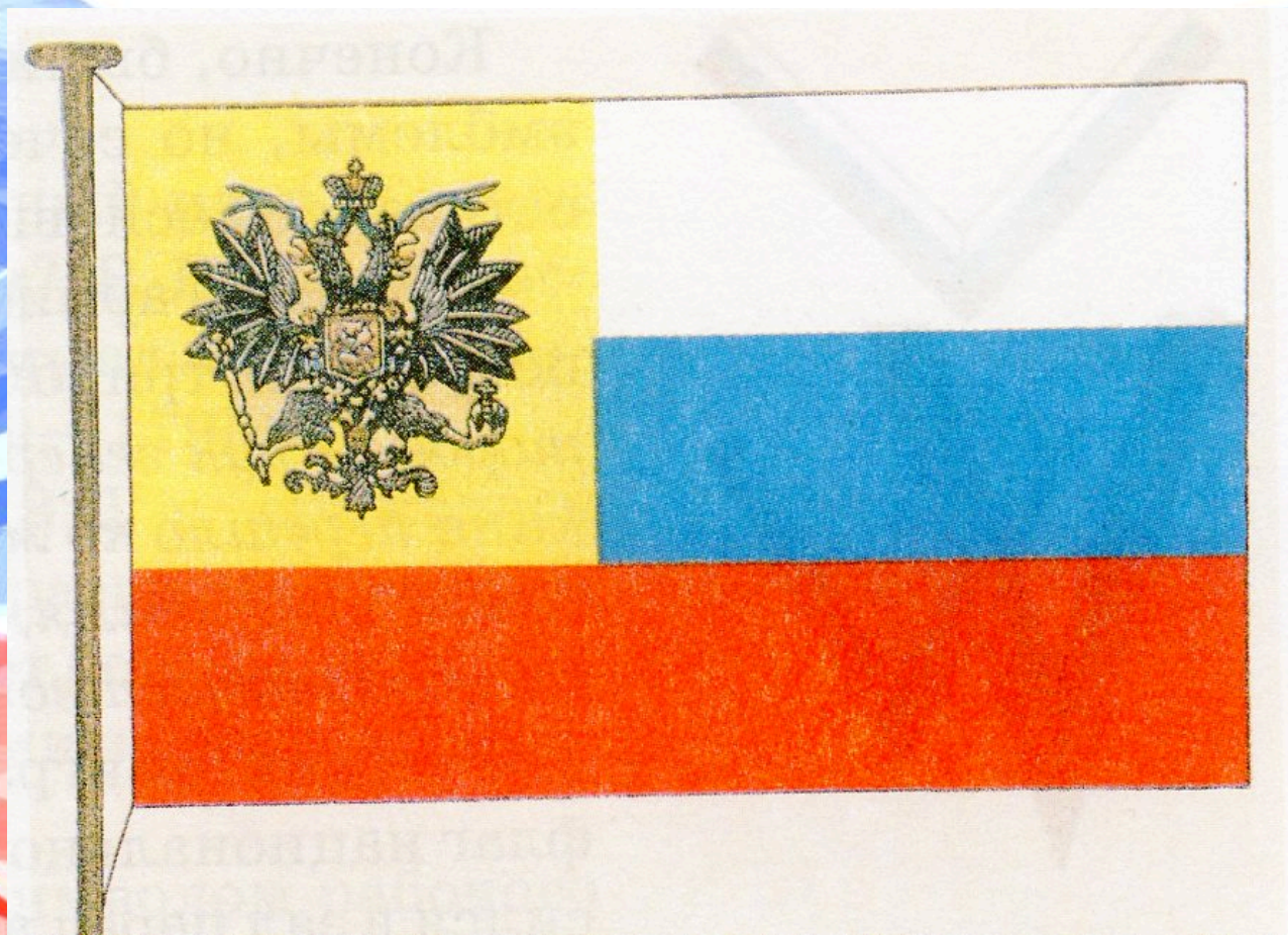
Государственный флаг Российской империи. 1914 г.

В годы Первой мировой войны (1914 – 1918) появился новый вариант российского флага – триколор дополнил чёрно-жёлтый императорский штандарт в верхней левой части флага. Бело-сине-красный флаг просуществовал до февральской революции 1917 г.