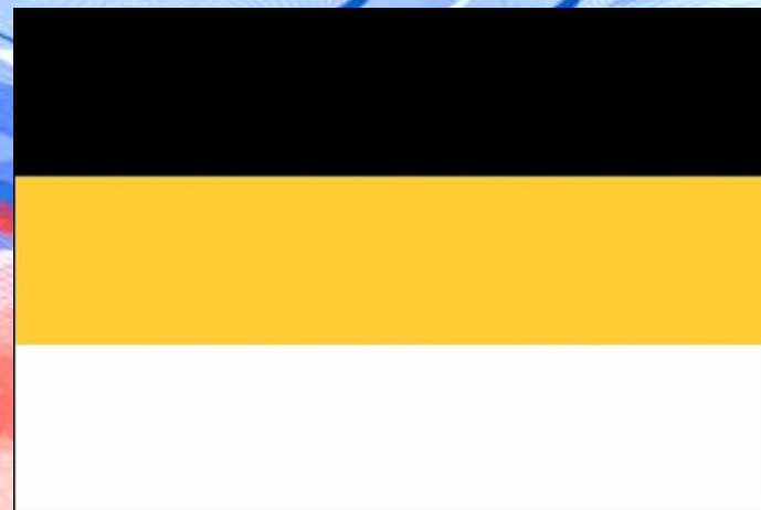
Государственный флаг Российской империи. 1858 г.

Указом Александра II в 1858 году был введен черно-желто-белый флаг как официальный флаг Российской Империи. Цвета флага соответствовали цветам государственного герба, их трактовали как символы земли, золота и серебра. Он просуществовал до 1883 года.