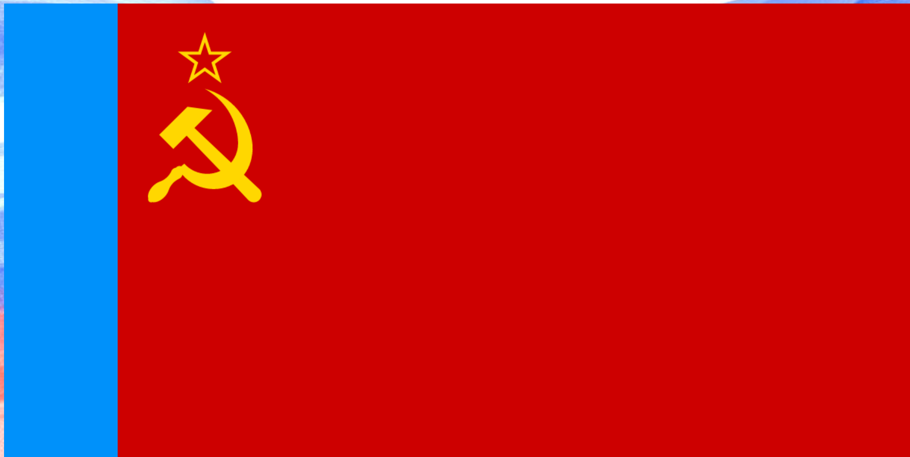
Государственный флаг РСФСР.1954 г.

Последним из флагов союзных республик был утверждён флаг РСФСР. Это произошло 9 января 1954 г. Флаг представлял собой красное полотнище со светло-синей полосой у древка во всю ширину. В левом верхнем углу были изображены золотые серп и молот, а также красная пятиконечная звезда.