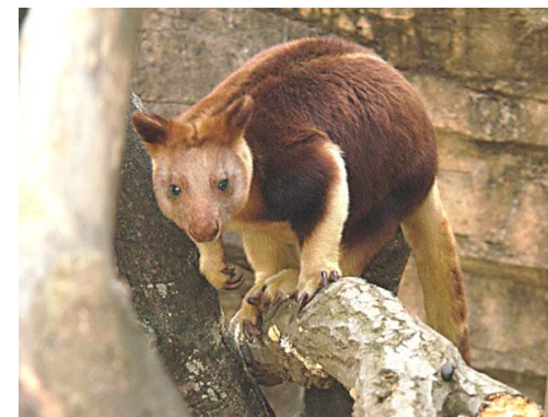
ВАЛАБИ. ДРЕВЕСНЫЕ КЕНГУРУ

Своё название получили оттого, что во время опасности издают звук, похожий на лай собак. Являются героями многих фильмов и мультфильмов.